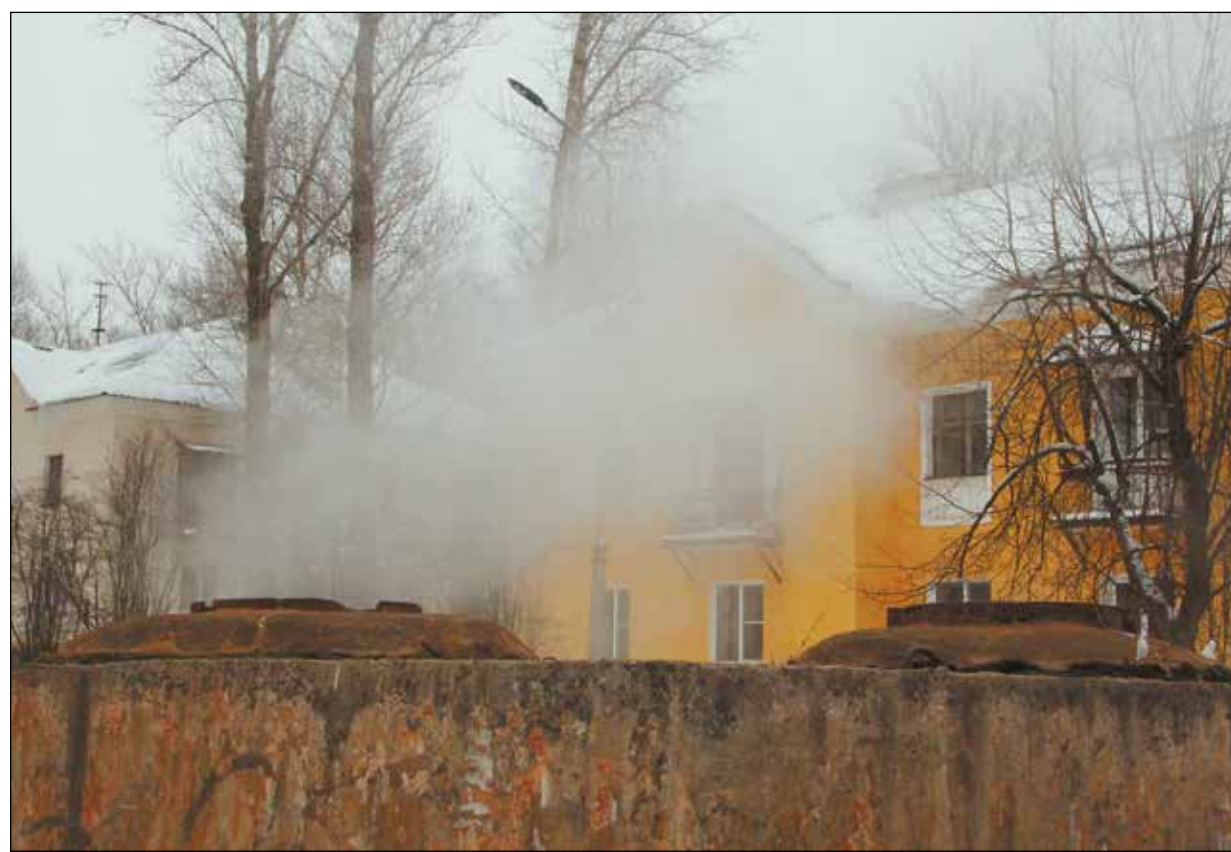
В местах, где идет пар – места протечек горячей воды

По мнению главы администрации, спасти теплоэнергетический комплекс Бокситогорска сможет только концессия. В прошлом году Бокситогорск получил на ремонт теплотрасс всего 4 млн рублей – этого крайне мало. С такими темпами финансирования привести в нормальное состояние все